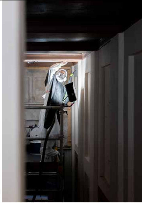
Dit jaar zijn de restauratoren begonnen met het balkenplafond in de gang. Hier legt een restaurator de oorspronkelijke decoratieve schildering op de balken vrij. Dit moet gebeuren met extra afzuiging en beschermende middelen omdat in de verf orpiment is gebruikt dat erg giftig is.