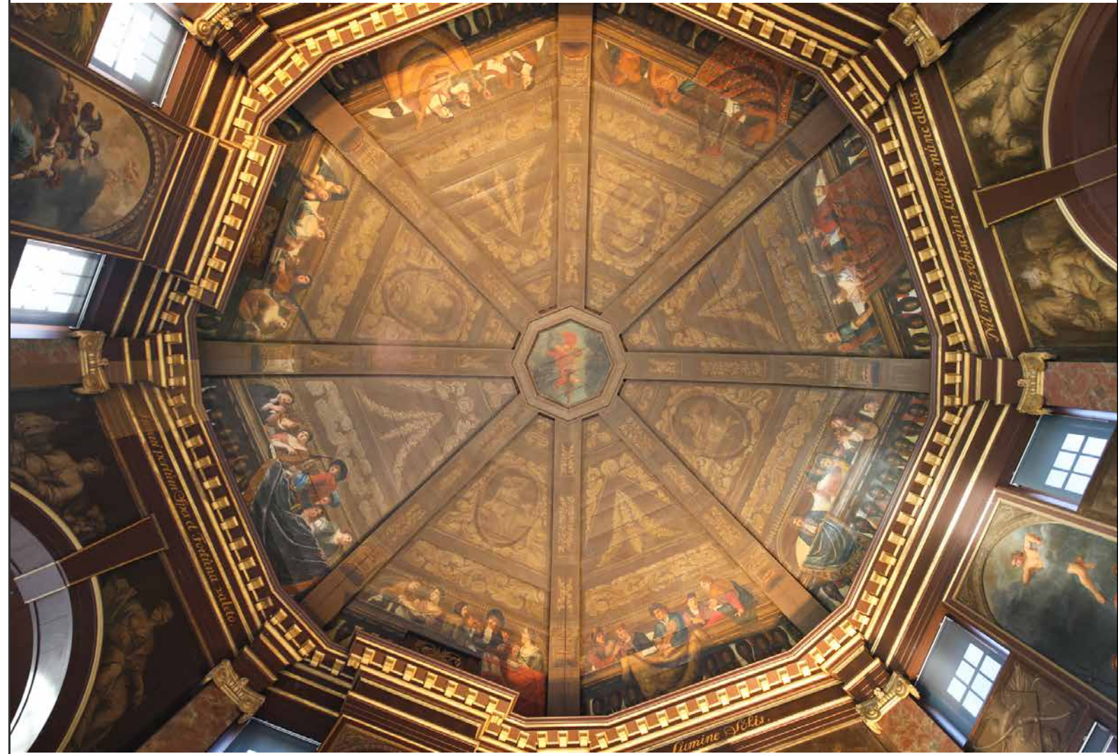
Plafond van de koepelzaal. Bij de wapenspreuk links is een gedeeltelijke reconstructie van de oorspronkelijke bruinrijze kleur van de pilasters en kroonlijsten te zien.

De maandelijkse fasering van het vrijleggen van het plafond in de vestibule.